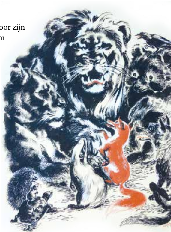
Afb. 2. Reynaert als gedaagde voor koning Nobel (Corina Smit).

Terwijl Isegrim, Bruun en Tibeert elders de galg voor voltrekking van het vonnis in gereedheid brengen, verzoekt de vos om een openbare biecht te mogen doen. In die (tweede) biecht criminaliseert hij de executeurs