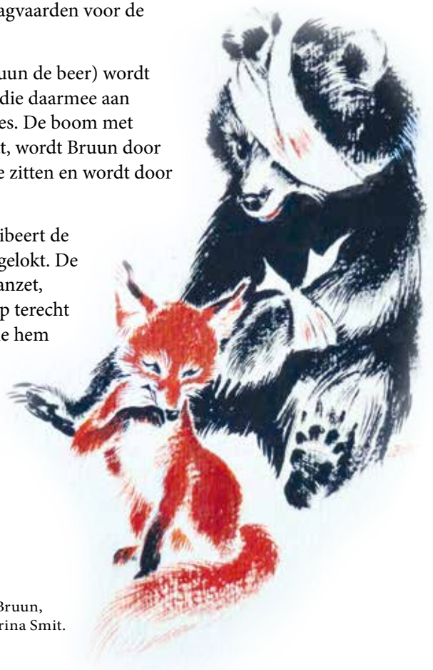
Afb. 1. Reynaert en Bruun, pentekening van Corina Smit.

Reynaert manipuleert zijn slachtoffers zo dat ze hun eigen ondergang tegemoet gaan. Aangrijpingspunt voor die manipulatie is de behoefte van het potentiële slachtoffer.