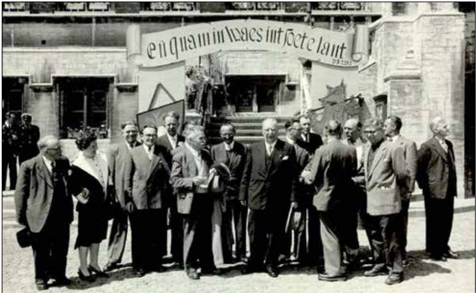
Afb. 1. Op 30 mei 1955 werd de eerste Reynaertroute ingereeden. Stijn Streuvels was de eregast.

Op 30 mei 1955 werd de route ingereeden met Stijn Streuvels als eregast (afb. 1). Overal tussen Hulst en Destelbergen werden in het pinksterweekend