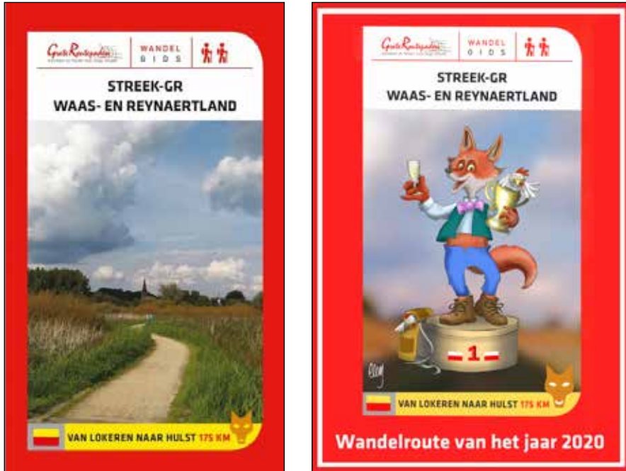
Afb. 10 en 11.

Sint-Niklaas doorheen het Waasland naar Hulst. De route is niet alleen 73 km langer geworden, het traject tussen Lokeren en Temse is helemaal nieuw. Het pad is daarenboven in beide richtingen beschreven. De nieuwe Reynaertstreek-GR is een kind van de nieuwe tijd. De wandeling slingert doorheen een landschap dat het bewaren waard is vanwege de rijke fauna en flora, de rust en de stilte (die er af en toe te vinden zijn), de waardevolle cultuurlandschappen en de nieuwe natuur. De boeiende streek en het literaire werk in de kijker zetten zijn nog steeds de hoofddoelstellingen, maar de natuur verkennen, de stilte opzoeken en het tot rust komen zijn voor de wandelende pelgrim nieuwe accenten. 11